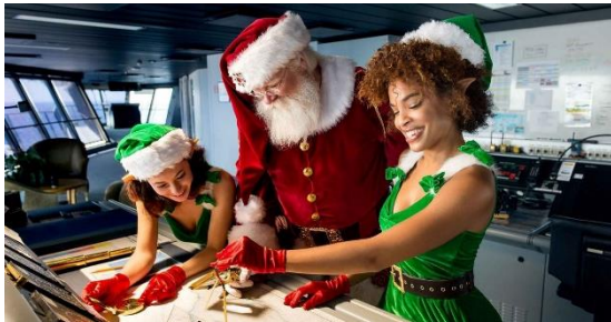
海洋光譜號 Spectrum of the Seas