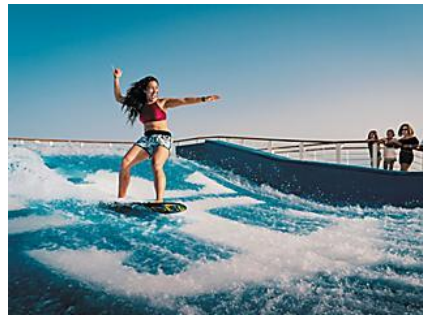
甲板衝浪®+甲板跳傘