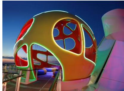
南極球 Skypad *新登場