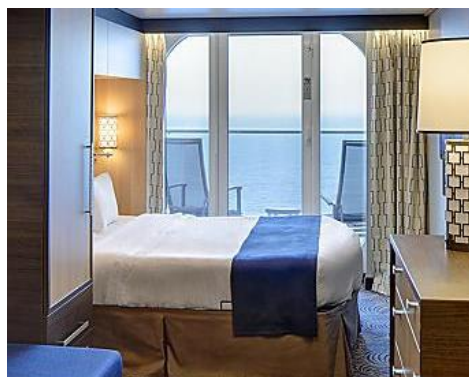
海景露台房 Oceanview Balcony