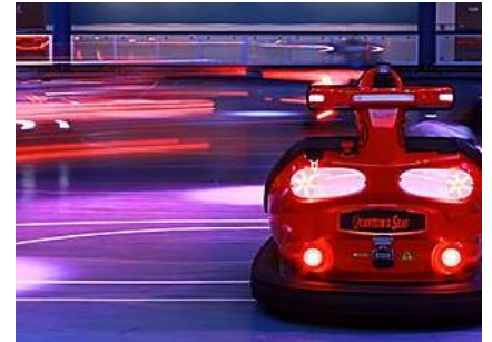
海上多功能運動場 (SEAPLEX®)