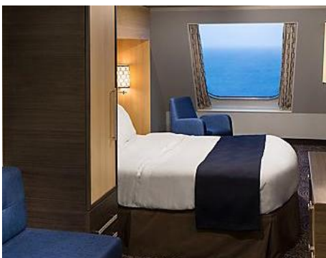
海景房 Oceanview Stateroom