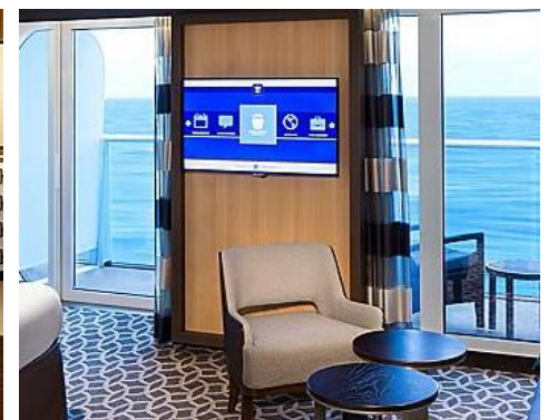
標準套房 Junior Suite