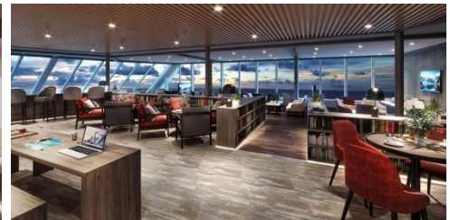
MS Eirik Raude

全新設計的 Explorer Lounge 船上酒廊，270 度的環迴落地玻璃設計令你盡收戶外景致，無論是冬日的極北光或夏天的午夜太陽，你皆可舒適地在此欣賞。