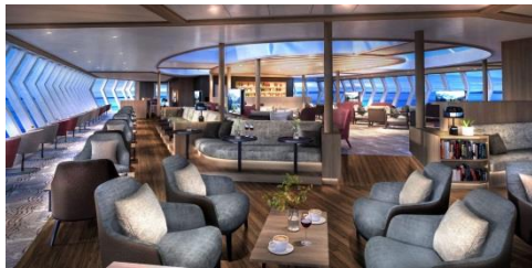
MS Otto Sverdrup