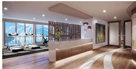
MS Otto Sverdrup