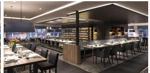
MS Eirik Raude 上的 Aune

船上 3 個餐膳選擇！包括了主餐廳 Aune；優閒輕食餐廳 Fredheim*；特色餐廳 Lindstrøm*。配合挪威當地的新鮮食材，勢必能夠滿足你的味蕾享受。