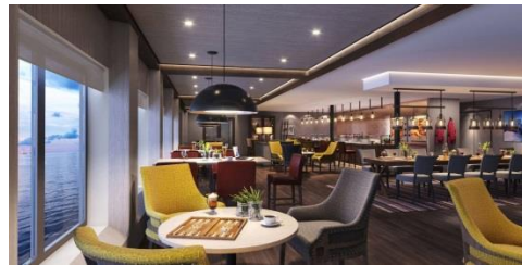
MS Eirik Raude 上的 Fredheim