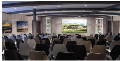
MS Eirik Raude 上的 Science center