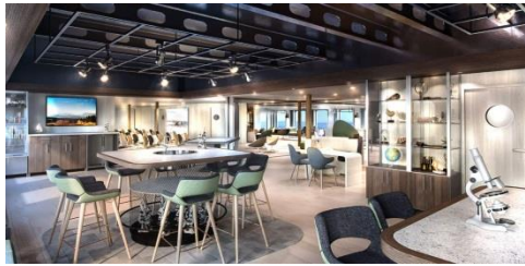
MS Otto Sverdrup 上的 Science center