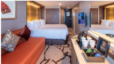
海景露台房 Balcony (BSS,BSA)