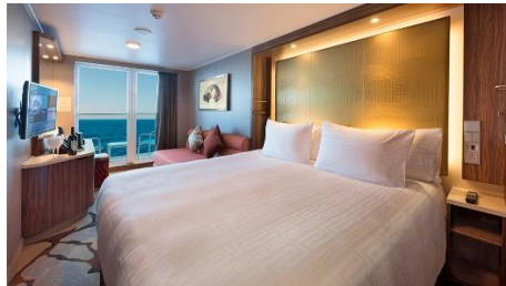
豪華海景露台房 Deluxe Balcony (BDS,BDA)