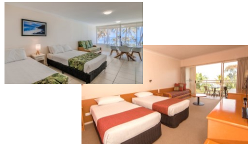
Hotel Standard Room/Resort Unit