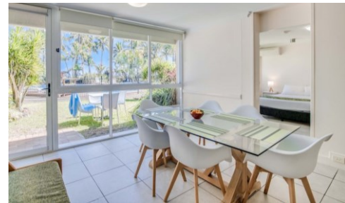
One-bedroom Family Suite