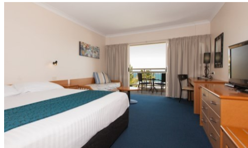
Hotel Deluxe Room - Ocean View