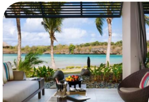
1 King Bed Lagoon View Room