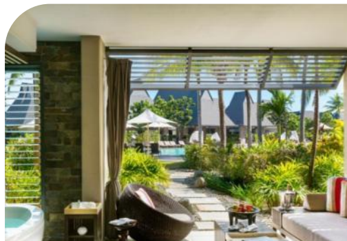
1 King Bed Pool View Room