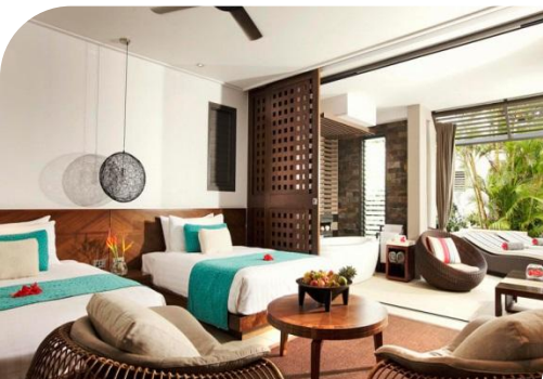
2 Double Beds Garden View Room