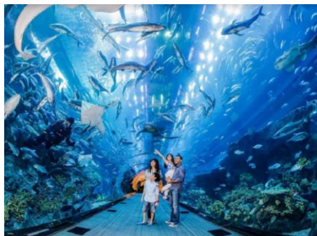
失落的空間水族館