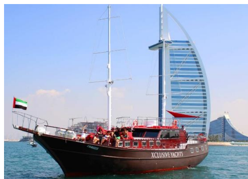
迪拜碼頭帆船之旅