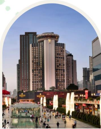
SHANGRI-LA HOTEL SHENZHEN