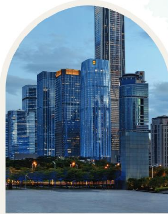
FUTIAN SHANGRI-LA SHENZHEN