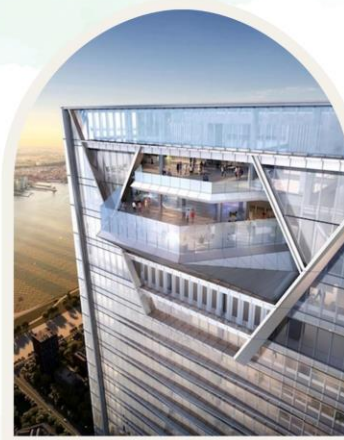
SHANGRI-LA NANSHAN SHENZEHN