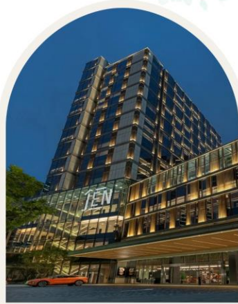
JEN SHENZHEN QIANHAI BY SHANGRI-LA